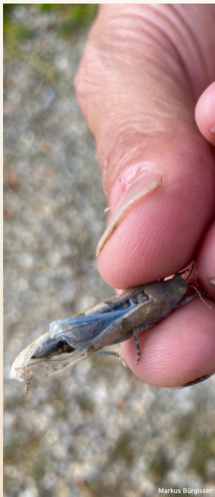
Ein Weinfelder Individuum der Blauflügeligen Sandschrecke (unten)