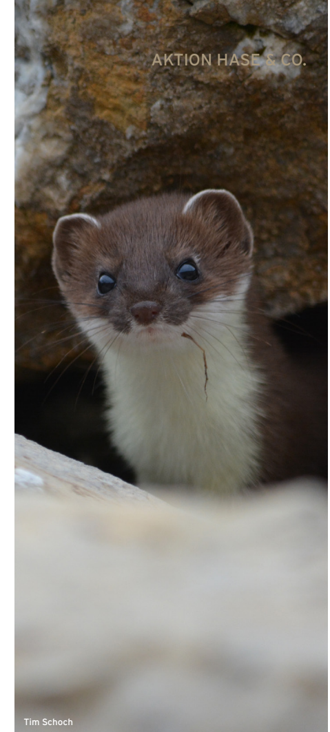
AKTION HASE & CO.

Weiter fördern wir das lokale Erbgut, indem wir zahlreiche Wiesen durch eine Schnittgutübertragung direkt begrünen. Dabei wird das frisch gemähte Schnittgut einer artenreichen Wiese direkt auf eine neue Fläche übertragen und verteilt. So kann durch das Saatgut der Wiese aus der direkten Umgebung eine neue, lokal angepasste Wiese entstehen. Durch diese Methode blühen im Thurgau bereits zahlreiche Wiesen, die alle den Ursprung aus einem unserer Schutzgebiete haben. (ts)