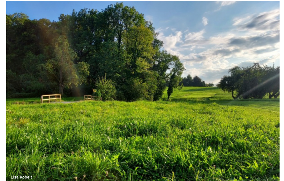
Auch die Fläche beim Hegibach bei Amriswil zeigt positive Ergebnisse

Geeignete Spenderflächen für die Mahdgutübertragung zu finden, kann schwierig und aufwändig sein, da diese selten in der unmittelbaren Umgebung auszumachen sind. Eine weitere etablierte Methode, um Flächen artenreicher zu gestalten, sind Saatgutmischungen. Hierbei wird eine optimal zusammenpassende Samenmischung auf die dafür vorgesehene Fläche verstreut. Obwohl die Handhabung einfacher ist als die Schnittgutübertragung, birgt diese Methode doch ihre Risiken. Samen aus fremden Regionen sind möglicherweise konkurrenzstärker und könnten sich ungehindert ausbreiten, während andere die klimatischen Bedin-